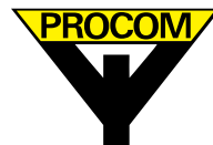
TABLEAU DES MODELES: