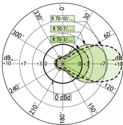
DIAGRAMME DE RAYONNEMENT TYPIQUE(Plan horizontal)

Si l'antenne est installée pour une polarisation verticale, cette courbe montre le diagramme de rayonnement dans le plan horizontal (couverture horizontale).